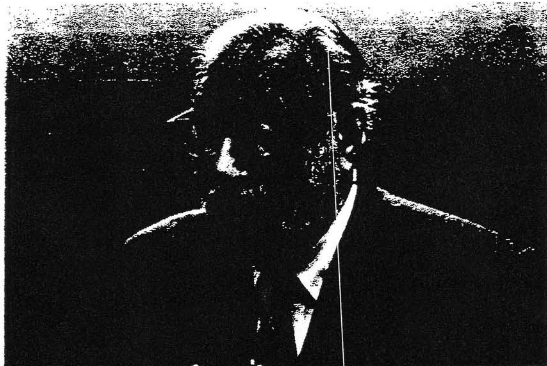
Il professor Salam, premio Nobel per la fisica, una sorta di bandiera del Centro di Miramare

pagare un affitto esorbitante. Qualsiasi operatore di mercato riconoscerebbe invece che si tratta dell'affitto equo di un albergo di quelle dimensioni».