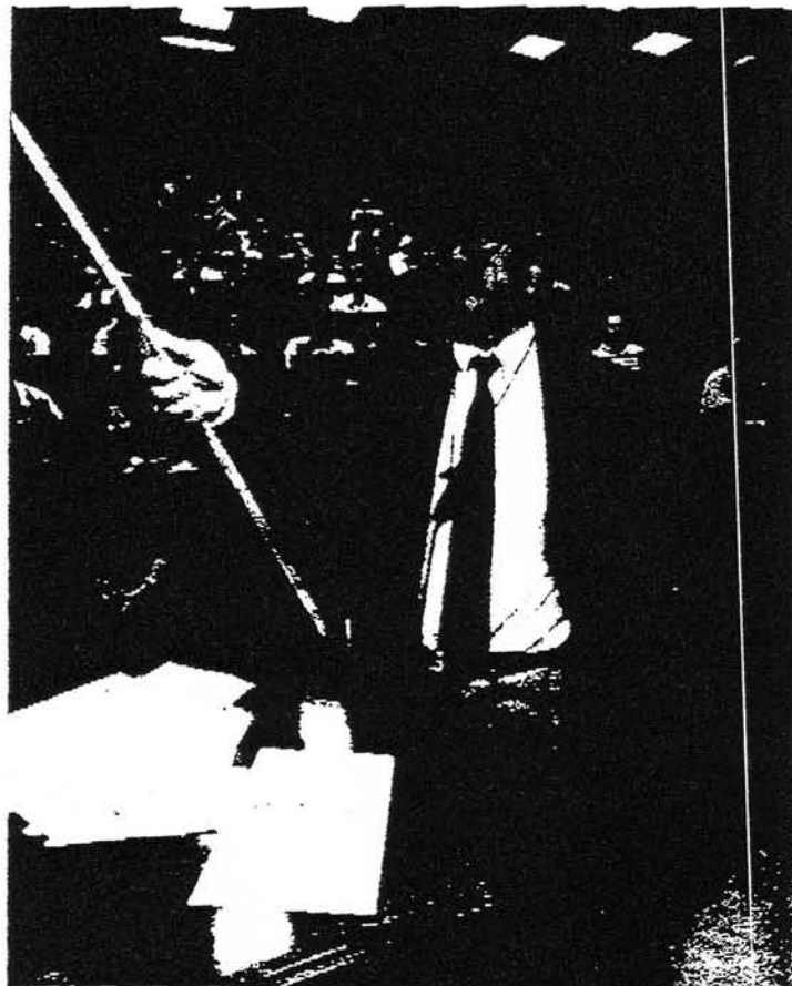
Due momenti (qui sopra e sotto) dell'attività didattica a Miramare. Prossimamente il Centro potrebbe passare sotto l'egida dell'Unesco

ste settimane, una questione ben più spinosa che ha investito la vita del Centro: il 30 giugno prossimo, infatti, giungerà a scadenza il contratto di affitto della Residenza Adriatico, di proprietà della società SICE