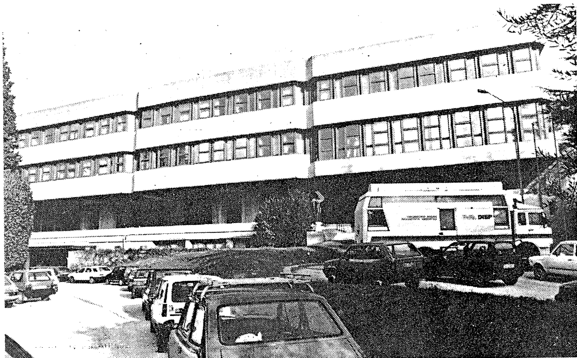
Dal 4 al 10 maggio, la settimana dedicata al mondo della scienza porterà a Trieste matematici e fisici di fama internazionale. Nella foto, il Centro di fisica teorica di Miramare.

«Voglio sapere come Dio ha fatto l'Universo. Non m'interessa questo o quel fenomeno, m'interessa conoscere l'essenziale» diceva Albert Einstein nel nome della scienza. Una scienza, purtroppo, sempre meno comprensibile ai «comuni mortali» e sempre più alla portata dei soli addetti ai lavori. Ma niente paura. Non sempre è così, per fortuna. La prossima sarà infatti una settimana interamente dedicata alla cultura e alla divulgazione scientifica. Per tutti. Un'iniziativa che interesserà più di 100 località italiane, impegnate nella realizzazione di circa 600 iniziative in campo nazionale. La manifestazione, finalizzata alla diffusione dei principali programmi di ricerca attualmente in corso nel nostro Paese, è promossa dal ministero dell'Università e della Ricerca, avrà inizio il 4 maggio e si protrarrà fino al 10. E' la «II Settimana della Cultura scientifica», alla quale hanno aderito anche numerosi enti locali, provvedendo all'organizzazione di una lunga serie di interessanti rassegne e seminari. Molti saranno gli esponenti illustri della matematica e della fisica italiana presenti ai vari convegni